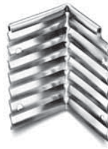
Eckverbinder Innen- und Außenecke