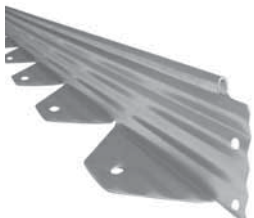
L-Profil stabiles Winkelprofil