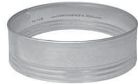
Halbrundprofil PRO Viertelrundprofil PRO