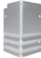
Eckverbinder PRO Innen- und Außenecke